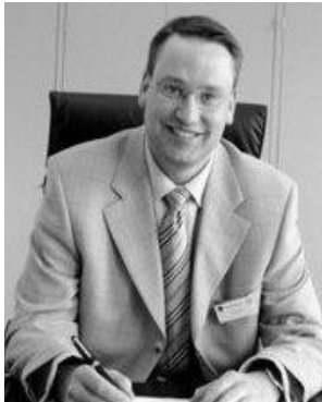
Ulf Stecher - Bürgermeister -